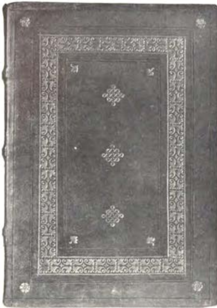
HANNOVER 1907, n. 25.