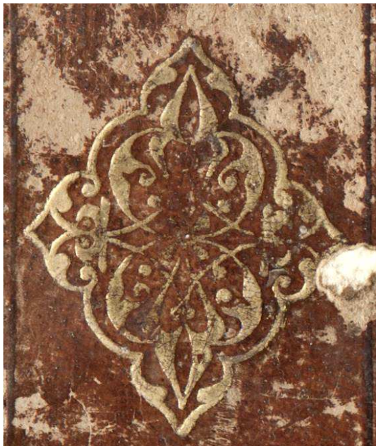
Ed. Ald. D 8, particolare.

Cfr. DE MARINIS 1960, II, n. 1693, tav. CCCXVIII, raccolta De Marinis, Cartellina per contenere fogli musicali , Firenze. Motivo ripreso anche in legature romane del secondo quarto del secolo XVI ad opera del legatore vaticano Mastro Luigi (DE MARINIS 1960, II, Firenze, Biblioteca Ricardiana, ed. rare 251, n. 2030, tav. CCCLXV, G. Pontano, Venezia, 1518).