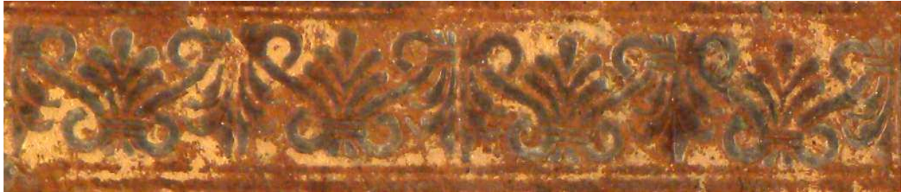
Mantova, Biblioteca Teresiana, Ms. 506, particolare.