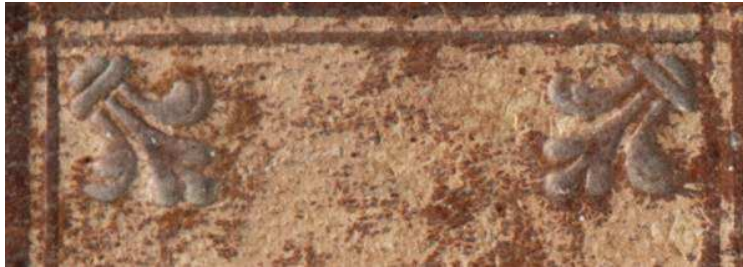
Ed. Ald. D 8, particolare.

Cfr. DE MARINIS 1960, II, n. 1693, tav. CCCXVIII, raccolta De Marinis, Cartellina per contenere fogli musicali , Firenze. Motivo ripreso anche in legature romane del secondo quarto del secolo XVI ad opera del legatore vaticano Mastro Luigi (DE MARINIS 1960, II, Firenze, Biblioteca Ricardiana, ed. rare 251, n. 2030, tav. CCCLXV, G. Pontano, Venezia, 1518).