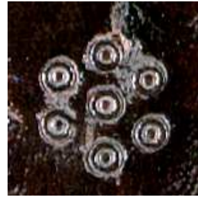
Mss. F 13, particolare.