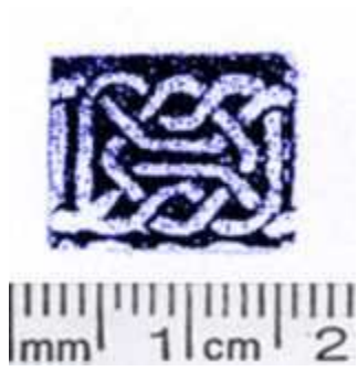
CLEM. Archivio C - Rettangolo, JLC – Rettangolo