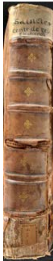
Mantova, Biblioteca Teresiana, III.D.1