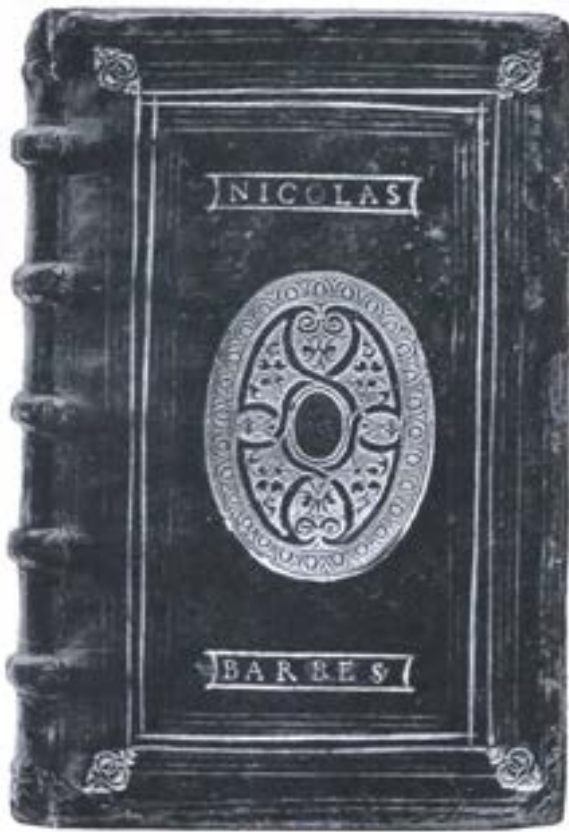
LIBRAIRIE GUMUCHIAN 1930, n. 109.