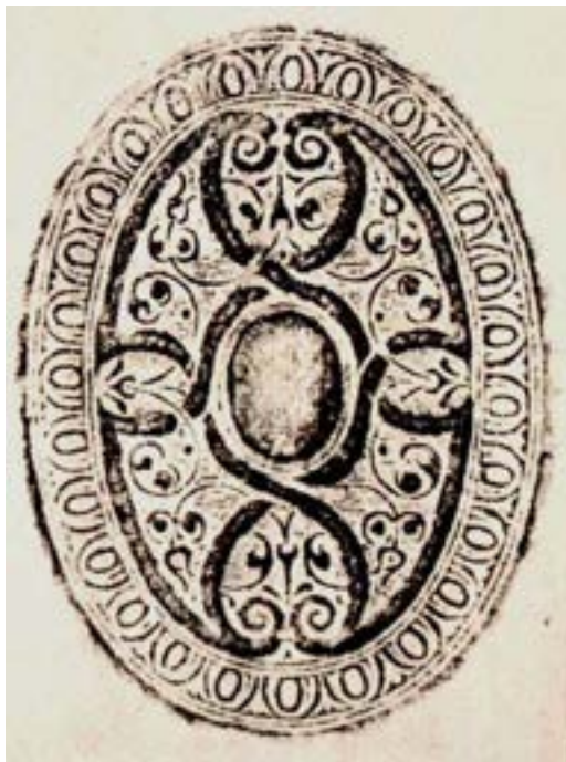
KYRISS 1969, Abb, 6, O9.