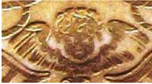
Bergamo, Biblioteca civica A. Mai, Cinq. 6 556.