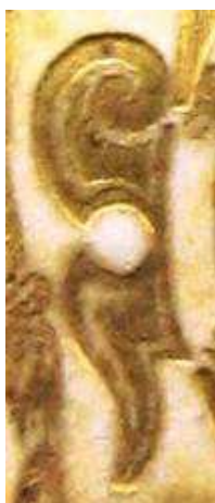
Bergamo, Biblioteca civica A. Mai, Cinq. 6 556.