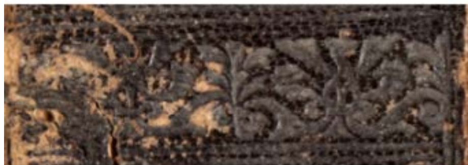
17 H 42-43, particolare. Cfr. infra .