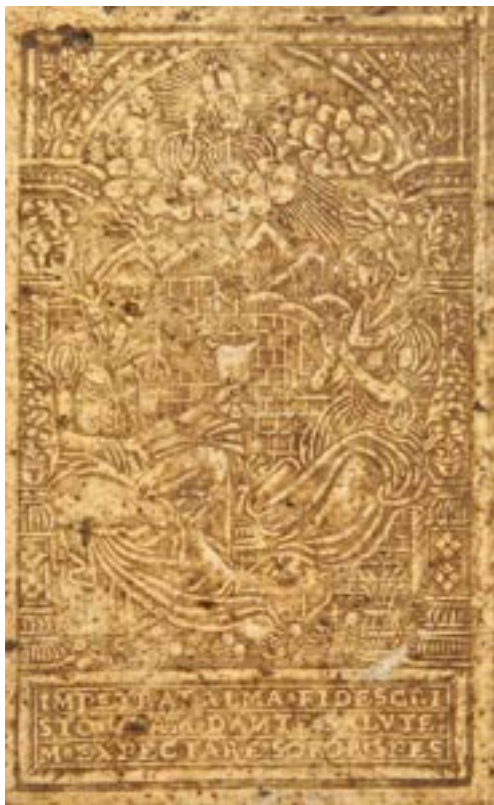
17 H 512, particolare.