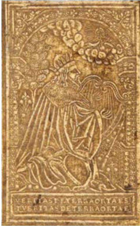
17 H 512, particolare.

EBDB p002886, EBDB w004452. Bottega München ESIG/A.gr.a.1054-1*: Esempio: München, Bayerische Staatsbibliothek: ESIG/A.gr.a. 1054-1, Homerus, Ilias , Strassburg, Theodosius Rihel, 1592.