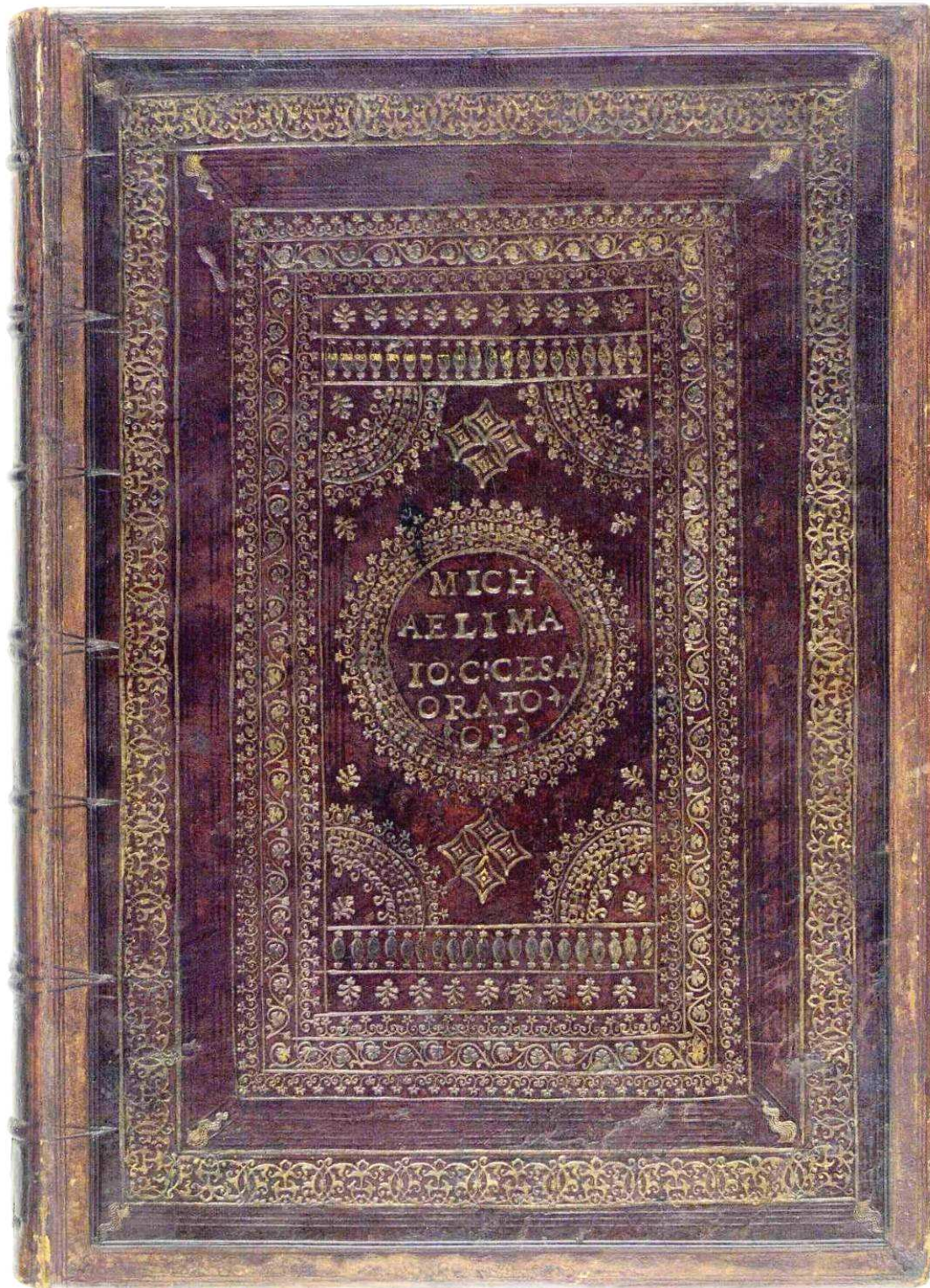
London, British Library, c.47.i.5, Rituum Ecclesiasticorum sive sacrarum ceremoniarum SS. Roman , Venice, 1516.