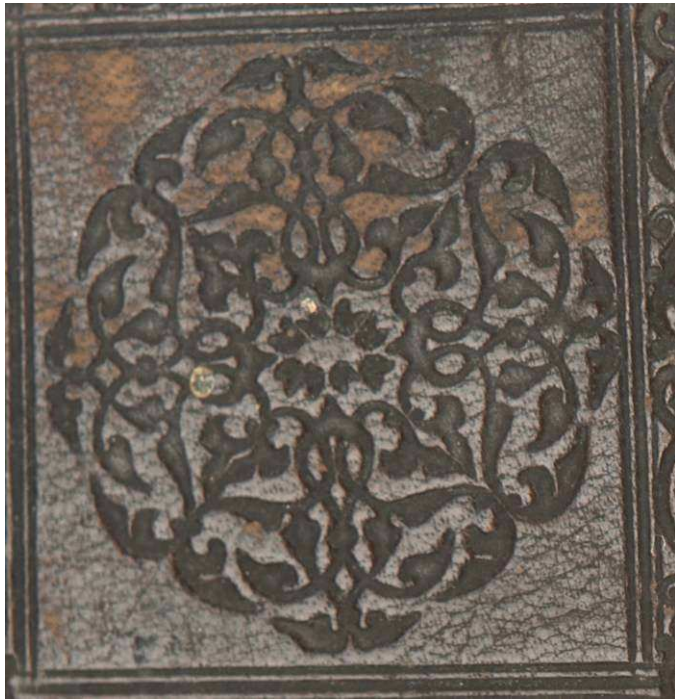
Ed. Ald. F. 34, particolare.