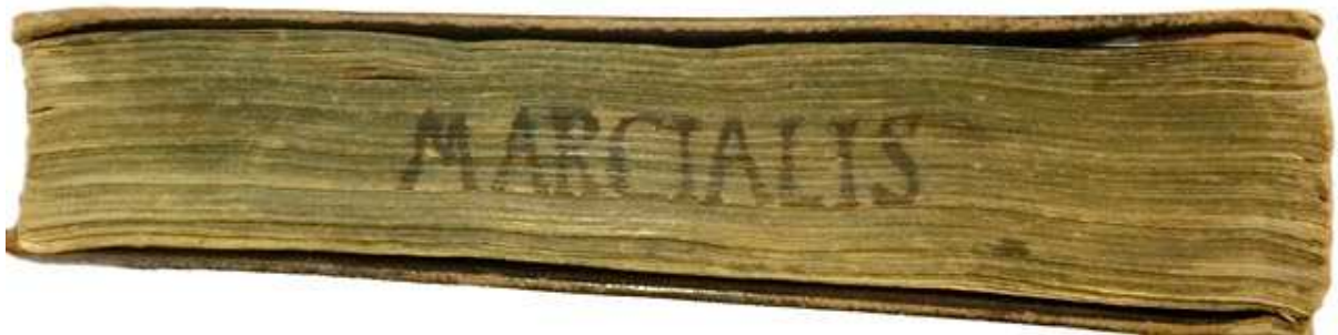
Ed. Ald. F. 34, particolare.