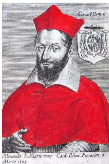
Ritratto del cardinale Alessandro d'Este.