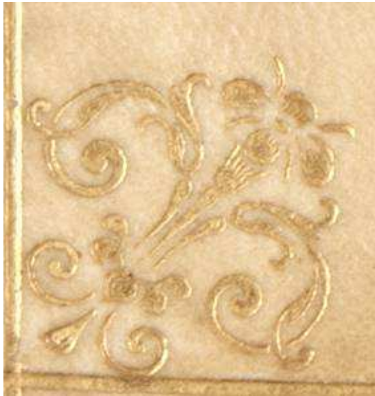
16 C 918, particolare.