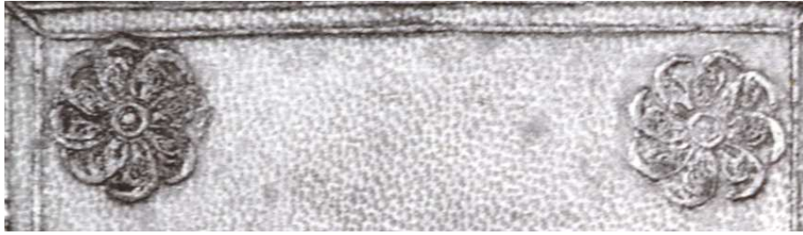
BIBLIOTECA CASANATENSE ROMA 1995, I, n. 556, II, fig. 230, b.I.8.