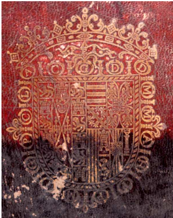
17 B 380, particolare.