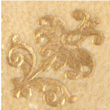
8 D 78, particolare.