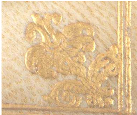
8 B 456, particolare.