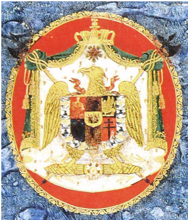
17 A 47, particolare.